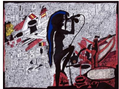
Kiyavash Danesh , Sans titre, Technique mixte sur papier, 29.5 x 41.5 cm, 2024