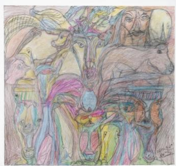
Mohammadali Dehghanizadeh , Sans titre, Technique mixte sur papier, 50 x 70 cm, 2022