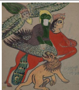
Haaj Mohammad Harati, Sans titre, Gouache sur papier, 31.5 x 26.5 cm, 1990