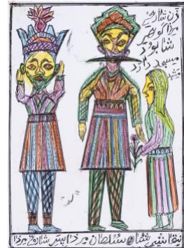
Kazem Ezi , Sans titre, Technique mixte sur papier, 30.5 x 25 cm, 2019