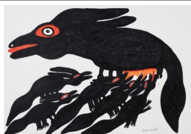
Mahmood Khan , Sans titre, Feutre sur papier, 50 x 70 cm, 2019