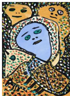
Limoo Ahmadi , Sans titre, Acrylique sur papier, 36 x 23.5 cm, 2021