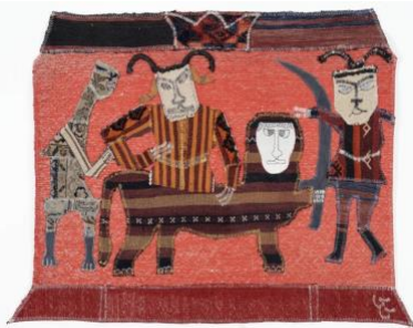
Sisi (CC) Asbahi Alireza , Sans titre, Textile, 81.5 x 112.5 cm, 2024