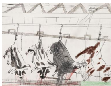
Alireza Maleki , Sans titre, Crayons de couleur sur papier, 21 x 30 cm, 2021