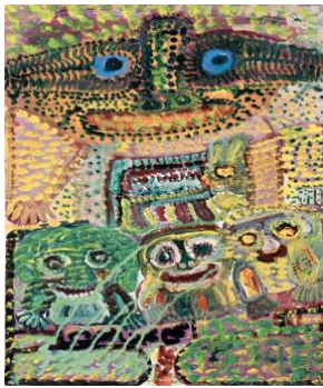
Ali Azizi , Sans titre, Acrylique sur papier