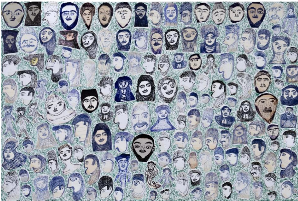
Salim Karami, Sans titre, Stylo sur papier, 70 x 50 cm, 2009

Dans un pays comme l'Iran où la culture est façonnée par l'héritage religieux du zoroastrisme et du soufisme, par sa littérature riche de grandes épopées et de poésie mystique, par le raffinement de son architecture et de ses jardins, par ses traditions artisanales et décoratives du tissage, de la miniature et de la calligraphie, la règle de l'art brut n'est pas contrariée. Les vingt quatre artistes présentés dans l'exposition nous en font la démonstration.