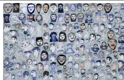
Salim Karami , Sans titre, Stylo sur papier, 70 x 50 cm, 2009