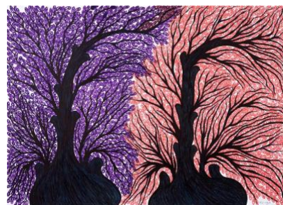
Farideh , Sans titre, Feutre sur papier 70 x 100 cm, 2022