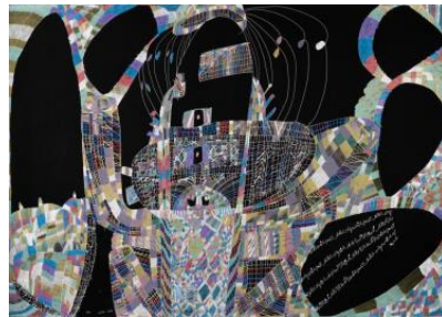
Mohammad Banissi , Sans titre, Feutre sur papier, 70 x 100 cm, 2021