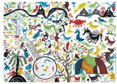
Mohsen Asgarian , Sans titre, Huile sur toile, 152 x 193 cm, 2017