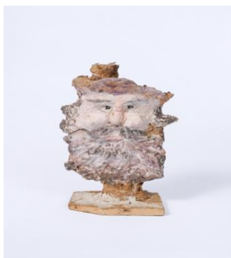
Hasan Hazermoshar , Sans titre, Technique mixte, 26.5 x 15.5 x 10 cm, 2005