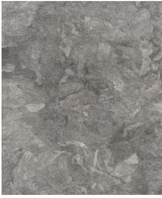
Sarvenaz Farsian , Sans titre, Rapidograph sur toile, 100 x 70 cm, 2021