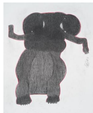
Davood Koochaki , Sans titre, Crayon sur papier, 100 x 70 cm, 2019