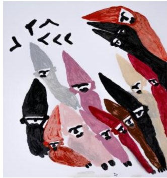
Jamshid Aminfar , Sans titre, Huile sur papier, 100 x 70 cm, 2022