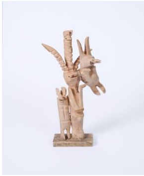
Abolfazl Amin Bidokhti , Sans titre, Bois, 40 x 15 x 12 cm, 2021