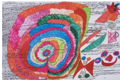
Nazanin Tayebbeh , Sans titre, Feutre sur papier, `, 50 x 70 cm, 2024