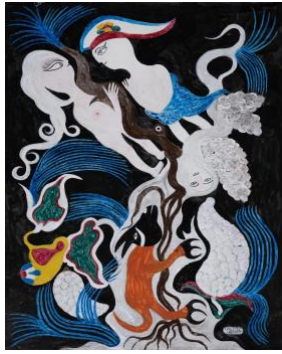
Abbas Mohammadi Arvajeh , Sans titre, Technique mixte, 70 x 50 cm, 2023