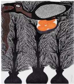
Mahmood Khan et Farideh , Sans titre, Feutre sur papier, 70 x 100 cm, 2020