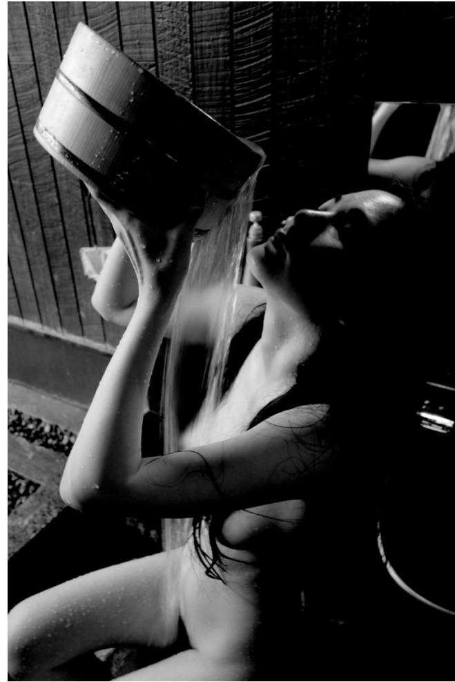
Bath Ritual in Hakone Tokyo, Japan - 2024, 60 x 40 cm