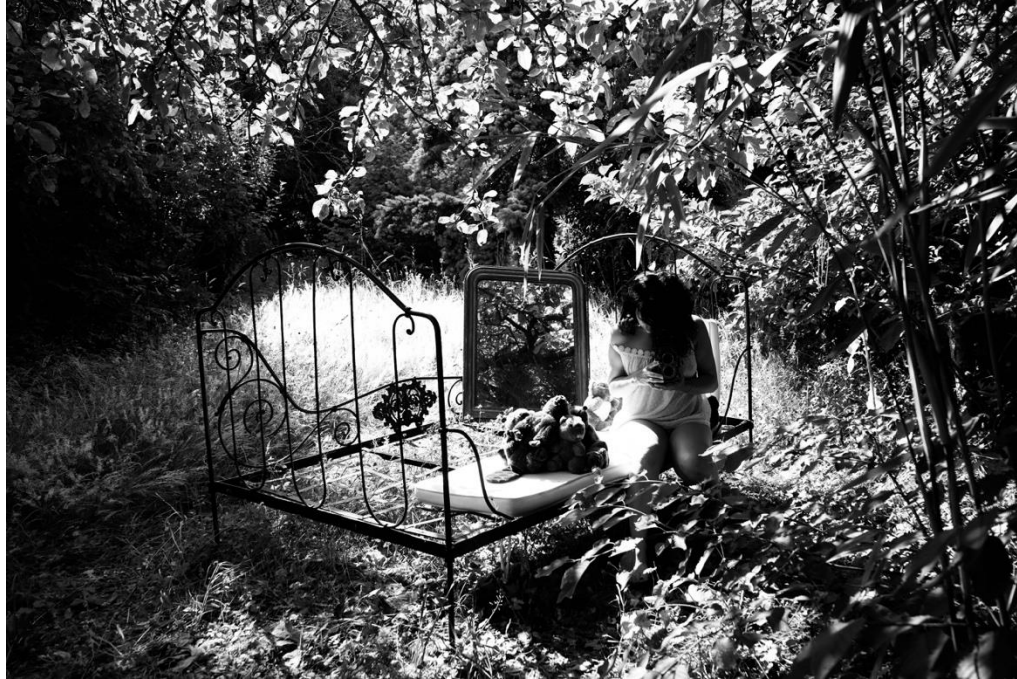
Le jardin aux sentiers qui bifurquent Brunoy, 2019 – 2023, 50 x 40 + 60 x 40 cm