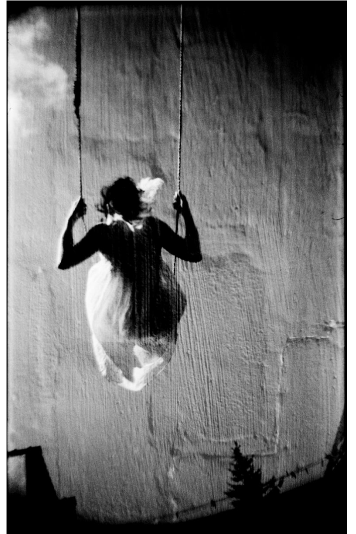
Daydreams – Secret Garden Brunoy 2016, 110 x 70 cm