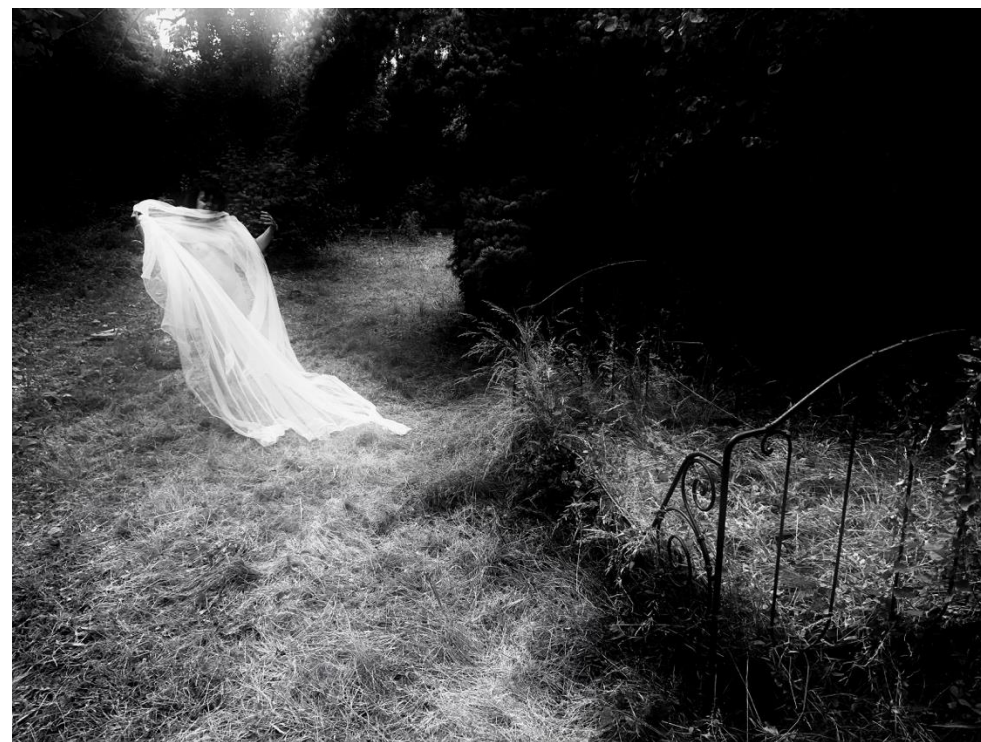
L'Ephémère Brunoy, 2021 - 60 x 40 cm