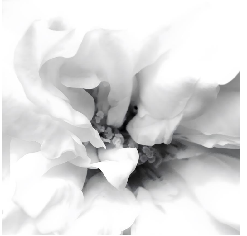
Le jardin aux sentiers qui bifurquent Brunoy, 2019 – 2023 , 110 x 88 + 120 x 80 + 80 x 80 cm