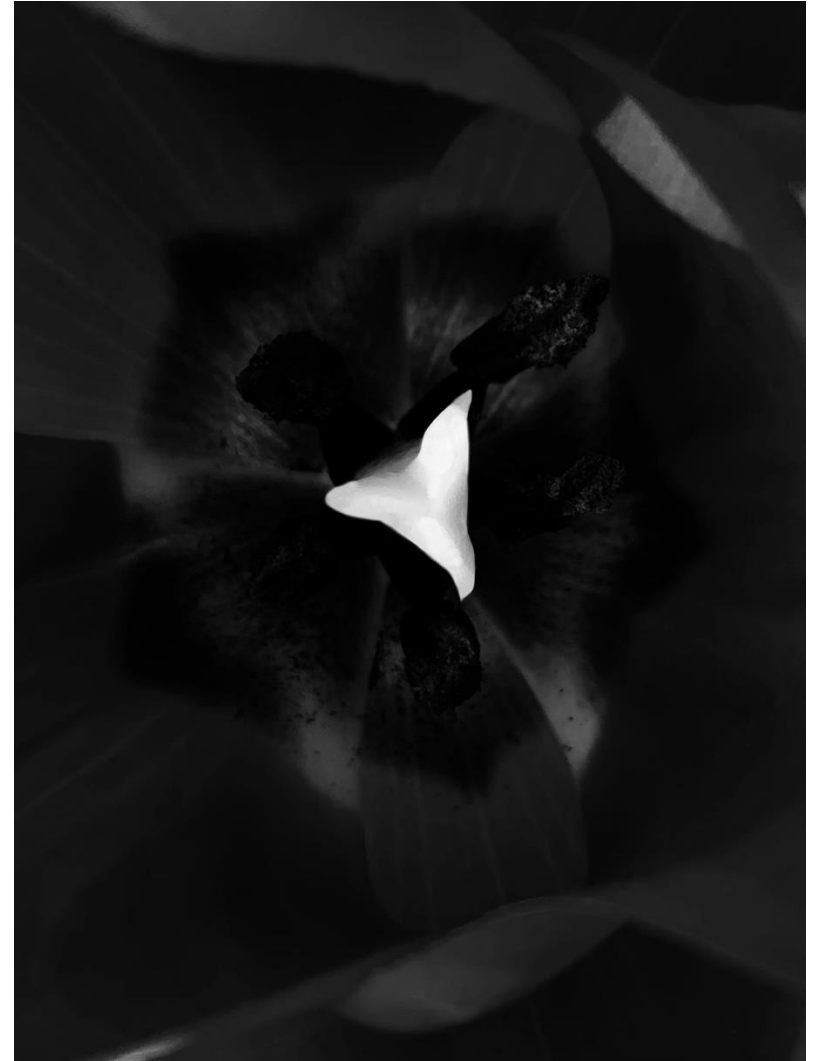
Le jardin aux sentiers qui bifurquent Brunoy, 2019 – 2023, 60 x 40 + 50 x 50 + 110 x 80 cm