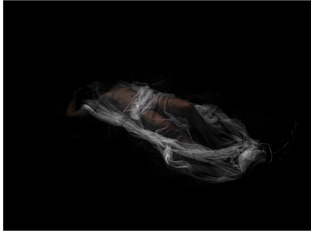
L'Ephémère Brunoy 2021 – 60 x 50 cm