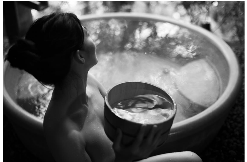
Bath Ritual in Hakone Tokyo - Japan, 2024, 60 x 40 cm